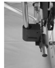
ボックスホルダー部