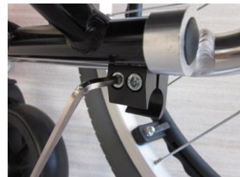
写真は右側のベースパイプ