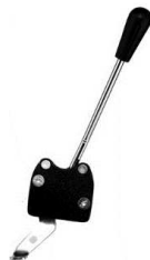
引き式タッグルブレーキ